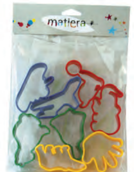
Accessoires de modelage (presses, moules...)