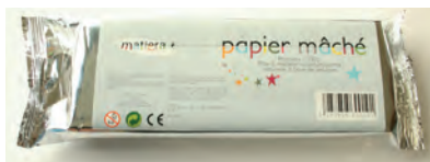
Papier mâché /Pâtes à bois (Pain de 500g prêt à l'emploi ou poudre)