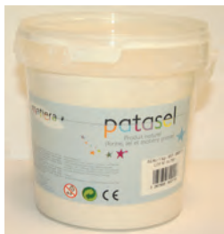
Patasel 1kg, 5kg