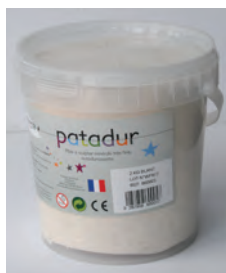
Patadur 500g, 1kg, 5kg