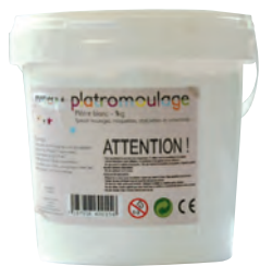
Platomoulage 1kg, 5kg